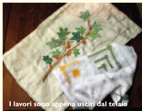
I lavori sono appena usciti dal telaio

L e immagini di queste pagine mostrano alcuni momenti dei corsi di ricamo classico e retini di riempimento, sfilature semplici e composte, sfilato siciliano al '500