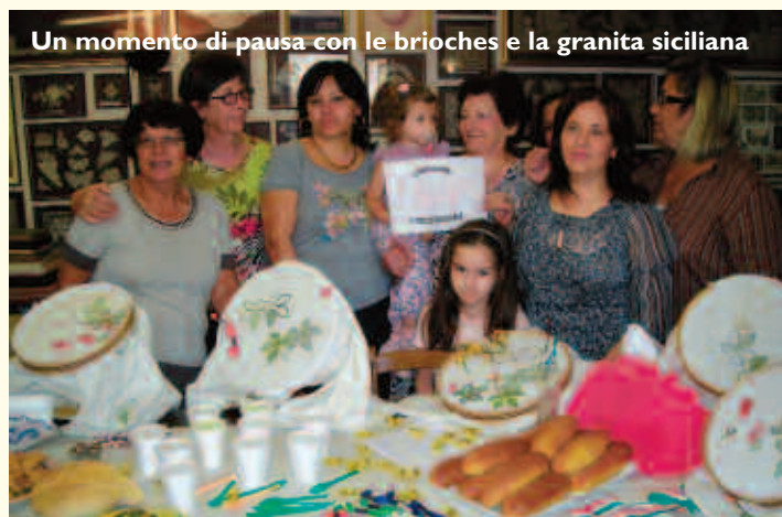
Un momento di pausa con le brioches e la granita siciliana